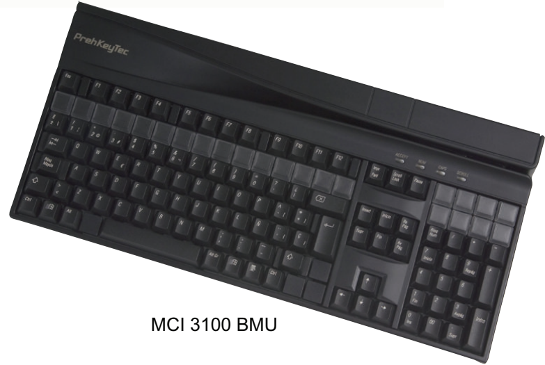
MCI 3100 BMU